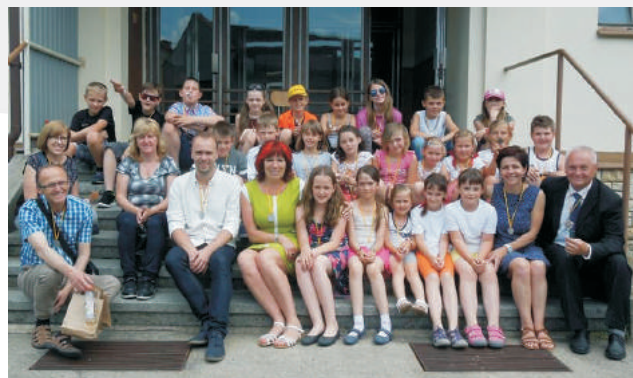
Obec Běšiny - Společná historie zábavně