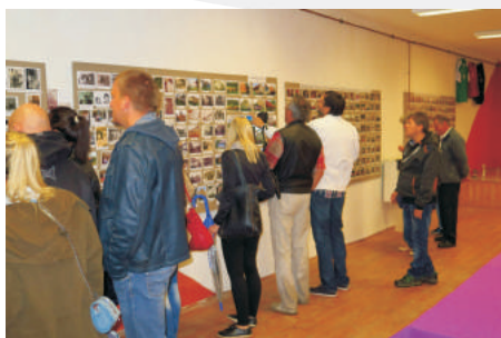
Obec Zahořany - Sraz rodáků