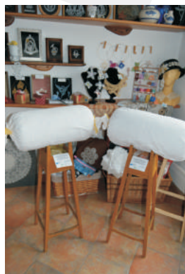
Město Sedlice - Paličkováná krajka Sedlice-Tiefenbach 2016