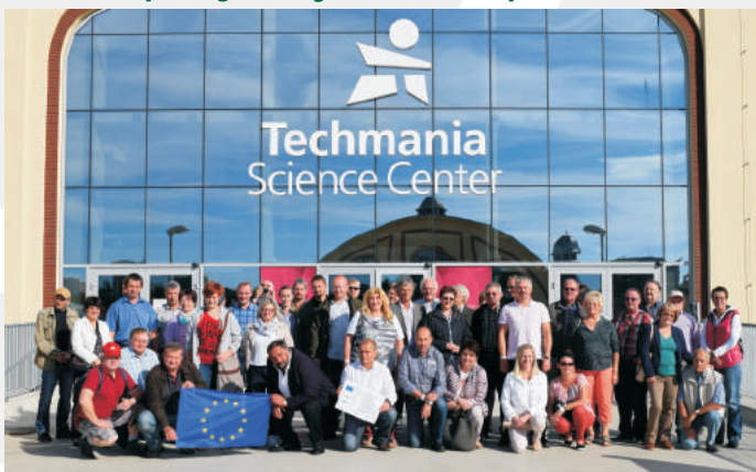
Město Hostouň - Rozvíjení partnerství při výpravě za poznáním