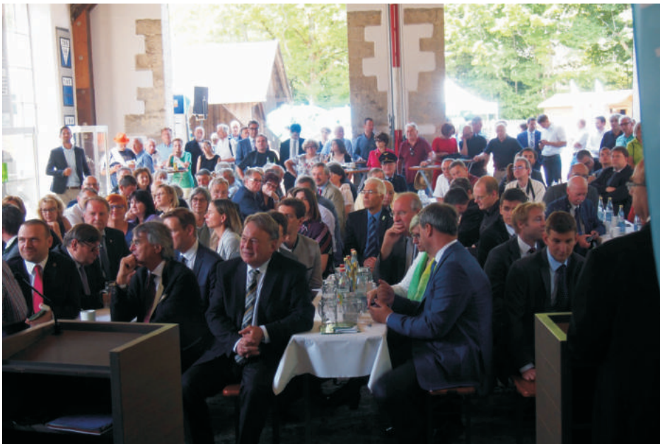
zahájení Týdne sousedů.

Zorganizovat celý tento týden si na svá bedra vzalo Centrum Bavaria Bohemia v Schönsee společně s týmem dalších lidí. Jistě se tak posílilo česko-bavorské příhraničí a další společné a neméně atraktivní projekty na sebe nedají dlouho čekat.