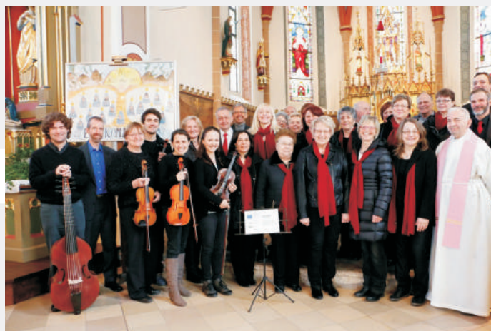
Consortium musicum, z.s. - InterArt