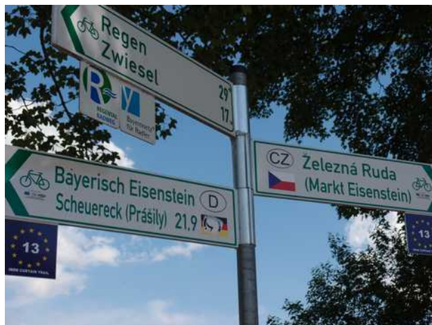
stezka Železná opona