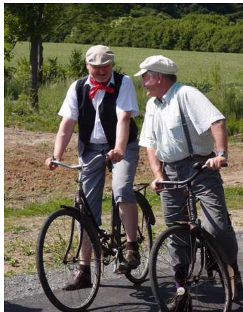
Přípravy pro slavnostní otevření.

http://www.plzenskonakole.cz/cz/novou-cyklostezku-u-svihova-otevrel-i-starostove-na-historickych-kolech-1138.htm