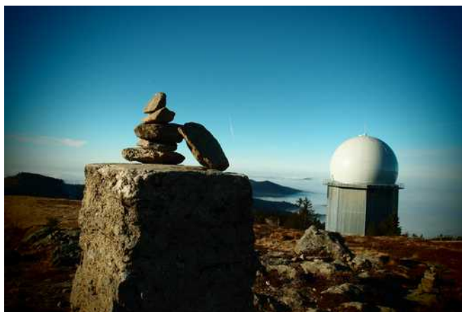
podzimní atmosféra ja Velkém Javoru