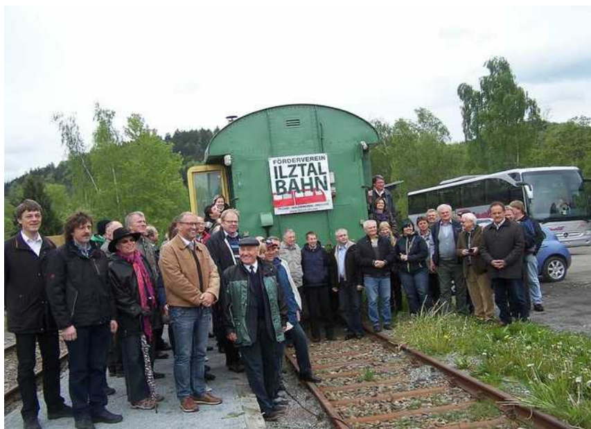
společné focení ve Waldkirchenu

Tato slavnostní jízda je součástí projektu „Euroregionální rozvoj hornorakousko-jihočeského příhraničí 2013-2014“, který je podpořen z programu Evropská územní spolupráce Rakousko-ČR 2007-2013.