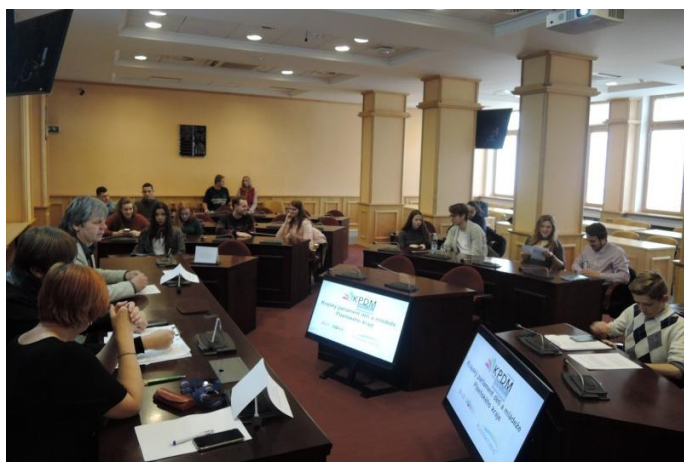
Zasedání KPDM.

Krajský parlament dětí a mládeže Plzeňského kraje (KPDM) byl zřízen v březnu 2016. Má více než 40 členů, což jsou mladí lidé z řad studentů ze všech středních škol v Plzeňském kraji, které jsou krajem zároveň zřizovány. Schůze parlamentu se konají jednou do měsíce. Parlament má své předsednictvo, které určuje směr a zároveň se stará o chod celého parlamentu. Nejdůležitější partner je Plzeňský kraj, se kterým se snaží úzce spolupracovat. Cílem je propojit žáky z různých škol, zkvalitnit studentský život, vytvářet prostor pro diskusi, upozorňovat na problémy, prezentovat zájmy dětí a mládeže v jakékoli oblasti běžného života.