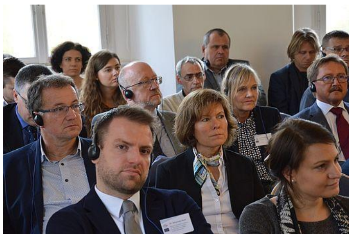
Účastníci z Bavorska i z České republiky.

Na základě představených a prezentovaných projektů mělo cca 50 účastníků z Bavorska i z České republiky, kteří se akce zúčastnili, možnost získat informace o nutnosti realizace projektů, které se zaměřují na oblast životního prostředí. Přednášky tak posloužily i jako návod, inspirace pro případné žadatele o dotační prostředky.