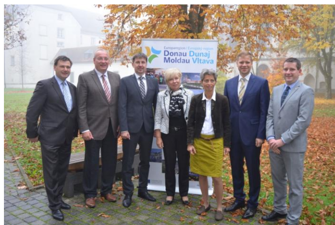
Prezídium ERDV.

Společnou cestou chce jít všech sedm regionů ERDV a chtějí i nadále využívat dotační prostředky EU. S možnými změnami dotační politiky EU v dalším programovém období od roku 2020 se situace může ale změnit. Je pravděpodobné, že se prostředky z EU budou krátit. Prezídium si nyní prověří a poté po důkladné analýze rozhodne, zdali by bylo smysluplné založit novou právní formu a využívat tak do budoucna finanční zdroje EU.